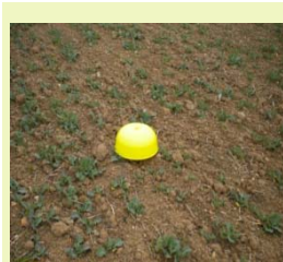
Valors baixos (menys de 0,5 kg /m 2 )

El cultiu no assolirà un rendiment òptim.