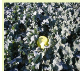
Valors alts (al voltant de 1,5 kg/m 2 )

No hi ha garanties d'obtenir rendiments òptims.